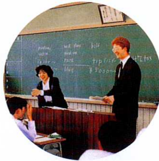
パブリックスピーキング