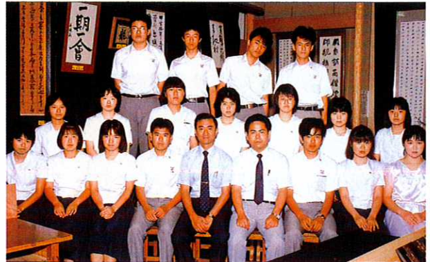
全国高校文化祭優良賞 (1986)