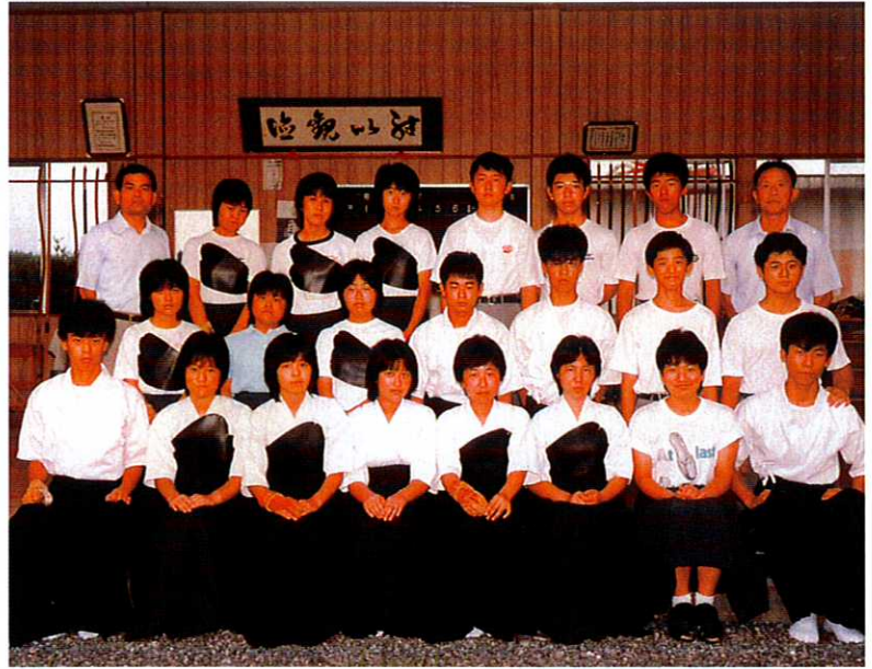
弓道部 (個人) 高校総体出場 (1984)